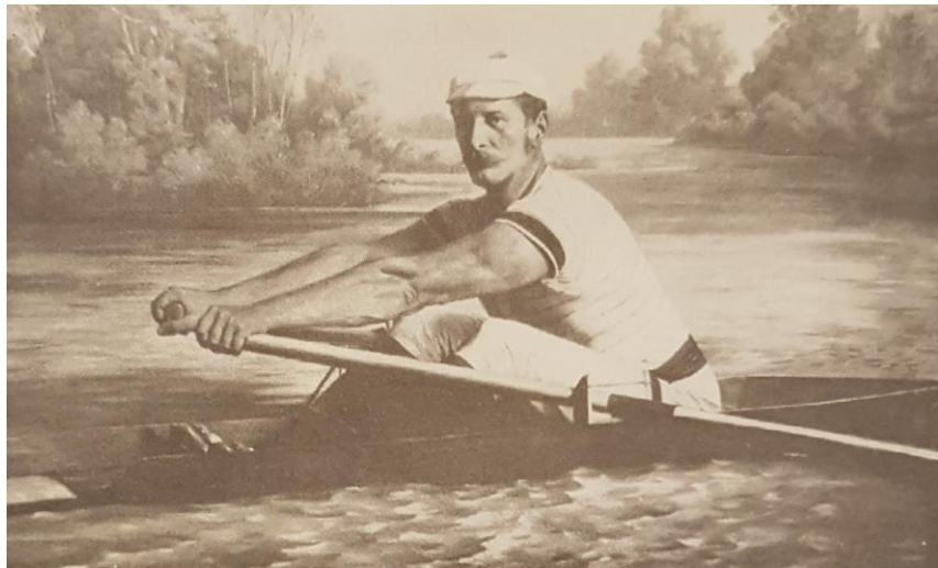
Victor Silberer 1873-ban (Fallend, 1995)

„A szerény körülmények közül származó Victor Silberer self-made man volt: 1870-ben megalapította a Wiener Salonblattot . 1873-ban átvette a Militärzeitung szerkesztését. 1877-ben adta ki kétkötetes, a Die Generalität der k. u. k. Armee című főművét. 1880-ban megalapította az Allgemeine Sport-Zeitungot . 1891-ben az antiszemita populista Karl Lueger nyomán a bécsi Városi Tanács tagja lett. 1902-ben az Alsó-Ausztriai Parlament tagja lett. 1907-ben, nem sokkal azelőtt, hogy egyetlen, rövid életű házasságából származó fia csatlakozott volna a Freudot körülvevő – akkor még tisztán zsidó – körhöz, helyet kapott a Reichsratban . Sikeres üzletember is volt: 1882-ben Victor Silberer építtette Bécs belvárosában az Annahofot (azt a házat, amelyben fia évtizedekkel később felakasztotta magát).” (Nitzschke, 1997)