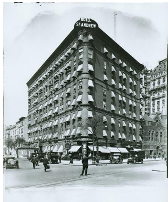
Ferenczi New York-i szállása, a Hotel St. Andrew

„Az elzárkózottság sokkal kisebb, mint amit a nagy európai városokban egész az utóbbi időkig tapasztaltunk. Már 17 évvel ezelőtt, amikor Freuddal először jártam itt, nemcsak nagy vendégszeretettel, hanem a legnagyobb megértéssel fogadtak” (Fodor, 1926, 9).