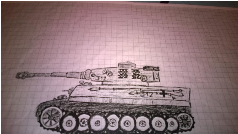
Egy saját harckocsi képe a virtuális valóságból