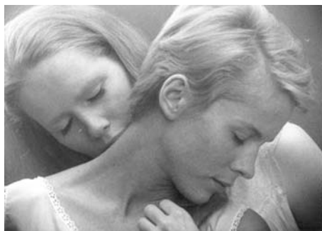
7. kép Ingmar Bergman (1966): Persona

A hazai vonatkozásokat tekintve Szabó Z. Pál (2003) Az andalúziai kutya tanulmánya, Stark András (2008) Bergman, Antonioni és Tarkovszkij elemzései és Erdélyi Ildikó (2012) Álmok című filmről készített értelmezései emelhetők ki, akik az álomfejtés pszichoanalitikus stratégiáját alkalmazva tárják fel az egyes filmek mögöttes tartalmát, jelentésrétegét.