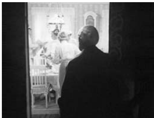
6. kép Ingmar Bergman (1957): A nap vége

tartalmak válnak megragadhatóvá, amelyhez a filmelemzés nem fér hozzá. Bizonyos filmek különösen hívják ezt az álomfejtésre alapuló értelmezési módot. Azokban az esetekben, amelyekben a film cselekménye nem a hagyományos felépítést követi, rendhagyó, nem logikus kapcsolatban álló jelenetekből áll össze, többlet jelenítés feltárásához vezethet egy álomanalógiát felhasználó értelmezés. Például Palombo (1995) értelmezése Greenaway Prospero könyvei -ről, Letzner és Ross (2005), illetve Vaida és Wildman (2005) értelmezései David Lynch Mulholland Drive -járól vagy Cowie (2001) tanulmánya Bergman A nap vége és a Persona című filmjeiről.