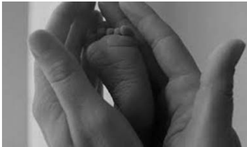
1. kép Terrence Malick (2011): Az élet fája

(Halász és Bódizs, 2001). Hartman (2008) vizsgálata az ún. nagy álom – azaz a jelentőségteljes, emlékezetes, nagyhatású álmok – legfontosabb ismertető jegyeit kutatta. Állítása szerint a nagy álom egyik legfőbb jellegzetessége, hogy rendelkezik egy erőteljes központi képpel, ami köré szerveződik az álom többi része. Maga Freud is részletesen kitér a manifeszt álom kifejezésrendszerének saját törvényeire, miszerint a látens gondolatoknak, jelentéseknek képekben kell kifejeződniük. Az ábrázolhatóság figyelembevételének követelménye alapján az álomgondolatok válogatáson, átalakuláson esnek át, s így elsősorban képek formájában válnak reprezentálhatóakká. Ennek két következménye van: a vizuális ábrázolásra alkalmas kapcsolatok előnyben részesülnek, és kiesnek a logikai kapcsolatok, vagyis az eltolásokat képszerű helyettesítők felé irányítja (Freud, 1900). Az ábrázolhatóság követelménye rárimel Balázs Béla azon megállapítására, miszerint „A film a felület művészete...a filmen is minden csak azon áll, hogy sikerül a rendezőnek a jelenetet képekben megragadni...” (Balázs, 1924, 28.). A vizuális ábrázolásmód, a képi kifejezés jelentőségét jól mutatja például Az élet fája (Terrence Malick, 2011) című film alábbi filmképe, amelyben a születés-jelenetben a rendezőnek egyetlen képbe sűrítve sikerül megjelenítenie az újszülött gyermekhez fűződő apai érzésvilágot.