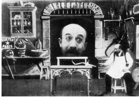
3. kép Georges Méliès (1901): L'homme à la tête en caoutchouc

a képzelet, az álom világába nyújtanak betekintést (Thompson és Bordwell, 2007).