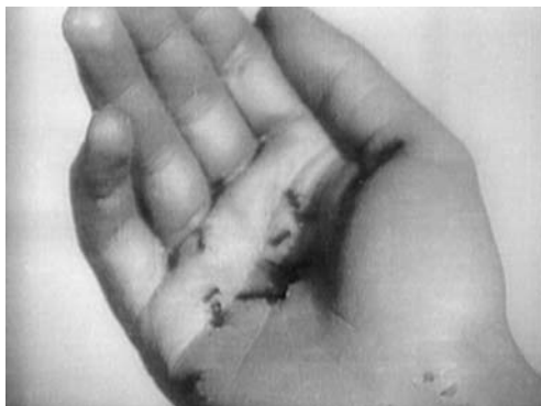
5. kép Luis Buñuel – Salvador Dalí (1929): Az andalúziiai kutya

Film és álom tartalmi kapcsolatának kitüntetett jelentőségű teoretikus megközelítése Baudry-tól (1999) származik, aki Lewin (1946) ún. álomernyő (dream-screen) fogalmát fejlesztette tovább, és a platóni barlang hasonlat közvetítő példáján keresztül tárta fel a lelki apparátus és a mozi-apparátus összefüggéseit hangsúlyozva a vetítés során megnyilvánuló vágyteljesítő folyamatokat. Lewin (1946) az álmodás folyamatát voltaképp filmanalógiával írja le. Elképzelése szerint az „álom kivétel egy fehér, az álmodó számára általában észrevehetetlen ernyőre, amely az anyamellet szimbolizálja úgy, ahogyan a gyermek azt elképzeletét követő álomban” (Laplanche-Pontalis, 1994, 28.). A barlanghasonlat pedig megerősíti az álmot és a mozi létrehozó lelki szerkezettel összefüggő vágy működé-