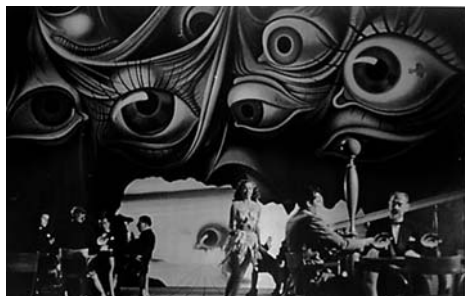
2. kép Alfred Hitchcock (1945): Bűvölet

kapó szabad asszociációs jelleg jól megfigyelhető például Alfred Hitchcock (1945) Bűvölet című filmjének alábbi filmképében.