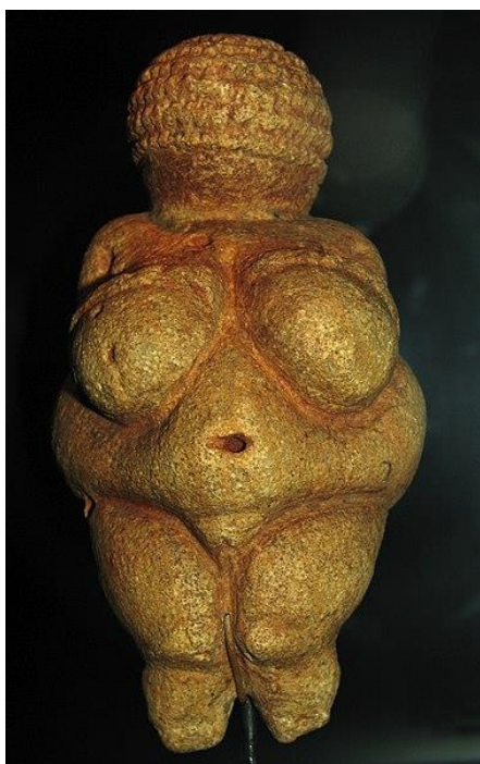
1. ábra. Willendorfi Vénusz (Alsó Ausztria).