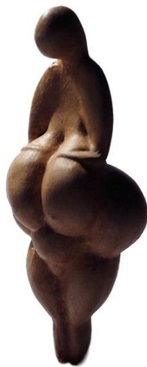
4. ábra. A Lespugue-i Vénusz szobor másolata (Amiens, Franciaország).