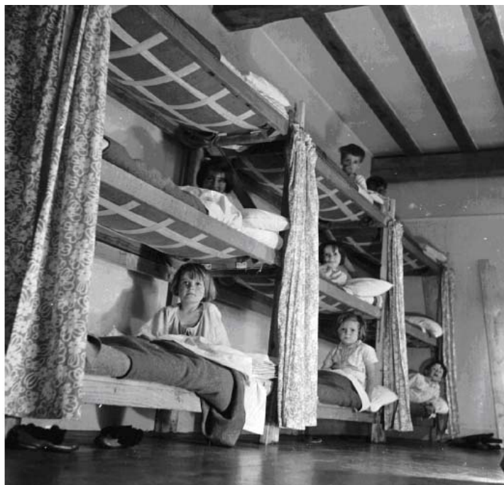
6. kép:

a gyermekotthonból Reggie kétéves és nyolchónapos korában, a kisfiú teljesen elvesztette és kétségbeesetté vált, és két héttel későbbi látogatásakor nem volt hajlandó ránézni sem. Azon az estén felült az ágyában és azt mondta: „Mary-Ann az enyém! De nem szeretem őt.” (I. m. 596.)