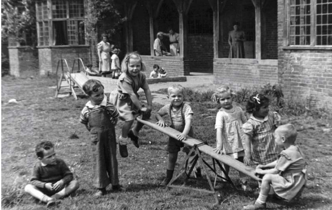
5. kép: A Plan (eredetileg Foster Parents Plan); engedéllyel közölve.

szeretné letagadni, ami történt – de mivel ez sosem sikerült teljesen, játéka szinte kényszeresen ismétlődött, egészen addig, míg néhány hónappal később végre képes volt beszélni édesapja haláláról (i. m. 197.).