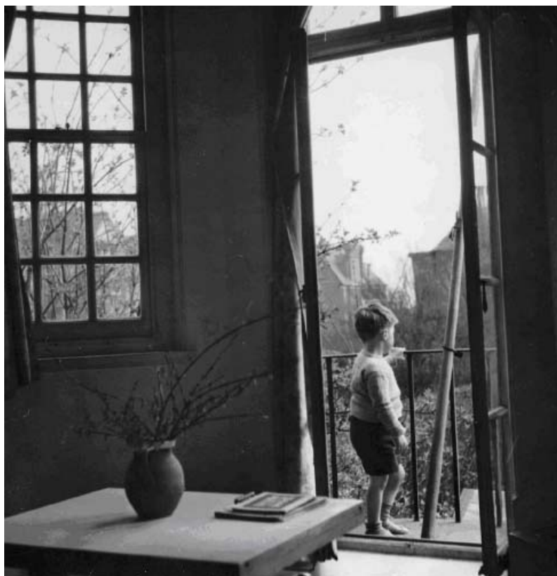
4. kép:

„A gyerek meg van rémülve szüleinek hiányától, és attól tart, hogy szülei azért hagyták el, hogy megbüntessék, sőt, a szeparáció egyenes következménye az ő rossz vágyainak. Hogy túltegye magát büntudatán, most túlhangsúlyozza összes szeretetét, amit valaha is érzett a szülei iránt. Az elválás természetes fájdalmából így lesz alig elviselhető, intenzív sóvárgás” (i. m. 189.).